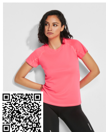
BAHRAIN WOMAN CA0408