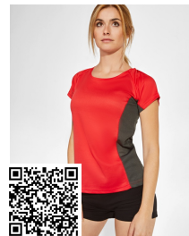
SHANGHAI WOMAN CA6648