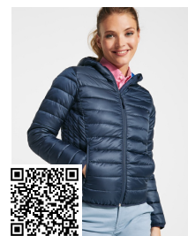
NORWAY WOMAN RA5091