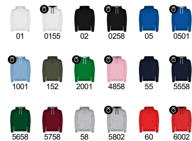
Duo Concept SU1068