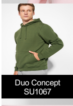
Duo Concept SU1067